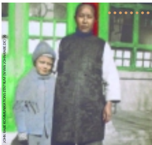
JOHN RABE (RECHTS) MIT SEINER FAMILIE IN CHINA (UM 1910)