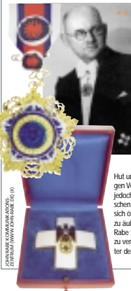
JOHN RABE: GÖTTLICHE GÜTE