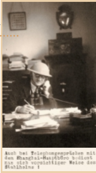
Auch bei Telefongesprächen mit dem Shanghai-Hauptbüro bedient Rabe sich vornehmlicher Weise des Stahlhelms!

In der Stadt bricht Massenpanik aus. Tsching Kai-schek flieht am 8. Dezember per Flugzeug. Auch Ausländer und Chinesen, die es sich leisten können, verlassen die Stadt. Zu Tausenden fliehen sie in den Hafen, wo sie von amerikanischen und britischen Schiffen aufgenommen werden.