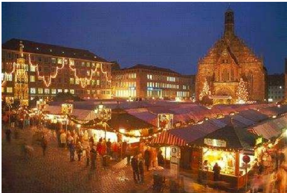
Nürnberg zur Weihnachtszeit