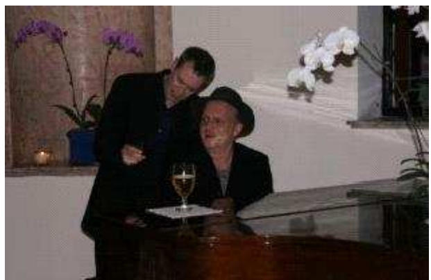
Steve Buscemi und Ulrich Tukur