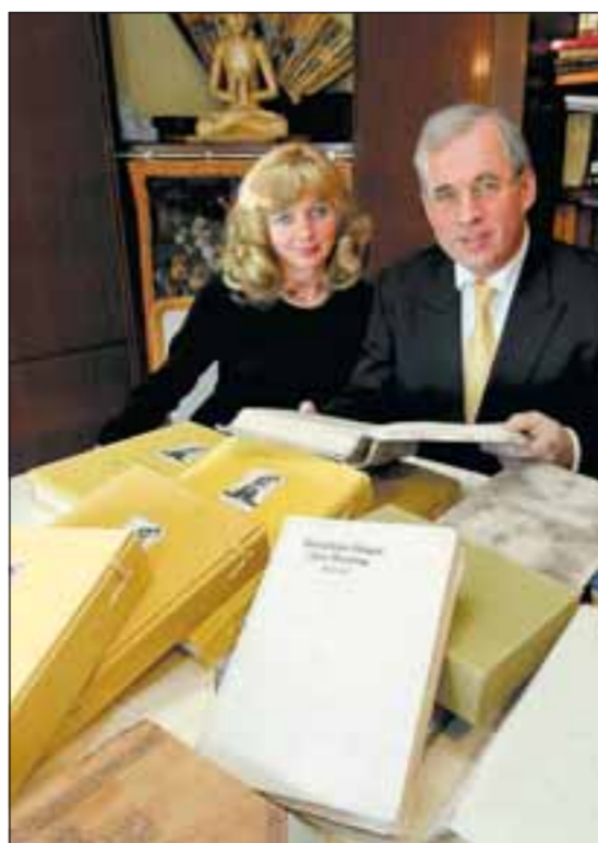
Das Wohnzimmer der Rabes gleicht einem Archiv. Hier türmen sich die Bücher und Aufzeichnungen von Großvater John Rabe.

Info: John Rabe Kommunikationszentrum e.V. Sparkasse HD, BLZ: 672 500 20, Kto.-Nr.: 9058117. E-Mail: thomas_rabe@yahoo.de