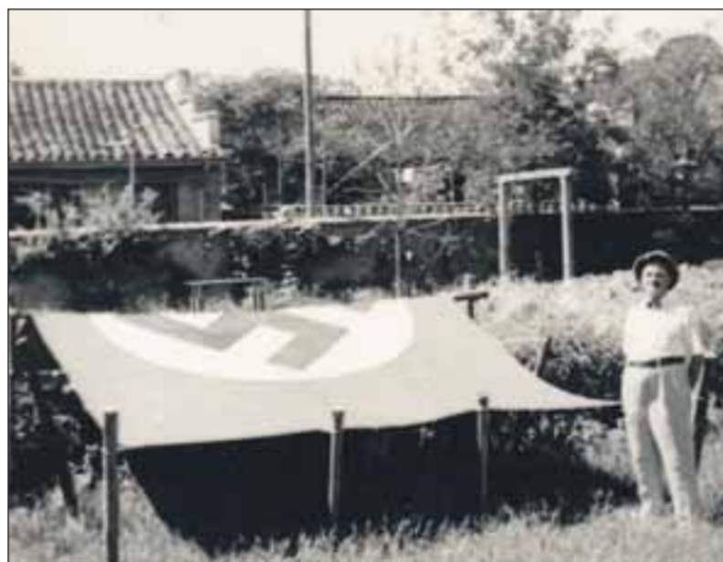
Im Garten seines Hauses spannte John Rabe die Hakenkreuz-Flagge auf. Damit wollte er die mit Nazi-Deutschland verbündeten Japaner abhalten, sein Gelände zu bombardieren. Rechts: Rabe (l.) vor seinem Büro in Nanking.

Seine aufrüttelnden Berichte an den „Führer“ hatten nur eines zur Folge: Rabe wurde verhaftet. Siemens sorgte dafür, dass er schnell wieder freikam. Zum Sachbearbeiter degradiert, entsandte man ihn nach Afghanistan. Nach dem Krieg wurde Rabe aufgrund seiner NSDAP-Mitgliedschaft von den Briten 1946 nur widerwillig entnazifiziert. „In Nanking der lebende Buddha ... hier ein Outcast. Da kann man schon vom Heimweh kuriert werden“, notiert er. Die Chinesen wollten ihren „Retter“ zurückholen, als sie von seinen ärmlichen Verhältnissen hörten. Wollten, ihn als Zeugen im Hauptkriegsverbrechertribunal in Tokio. Doch er lehnte ab. Er wollte keine „Japaner hängen sehen“. John Rabe starb 1950 verarmt nach einem Schlaganfall in Berlin.